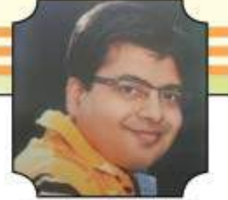
ચિ. પરિન કિશોર છાડવા

લિ. મેનેજીંગ ટ્રસ્ટીઓ - અનુદાન માટે સંપર્ક :